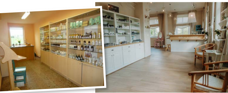
Takto vypadala naše první prodejna.

Psal se rok 2004, když jsme otevřeli první prodejnu Nobilis Tilia. Nebo spíše jednoduchou výdejnu produktů ze skladu. Prostory ale časem nevyhovovaly a my hledali nové vhodné místo v rámci areálu. Spojení prodejny a bylinkové čajovny se ukázalo jako skvělá cesta, protože v sobě spojuje zážitek pro smysly čichové i chuťové . A spojení vydrželo i po přesunu v roce 2016 do opravené bývalé vesnické školy, do dnešního Návštěvnického centra. Nechte se zlákat širokou nabídkou voňavé kosmetiky. Radi vám s výběrem pomůžeme!