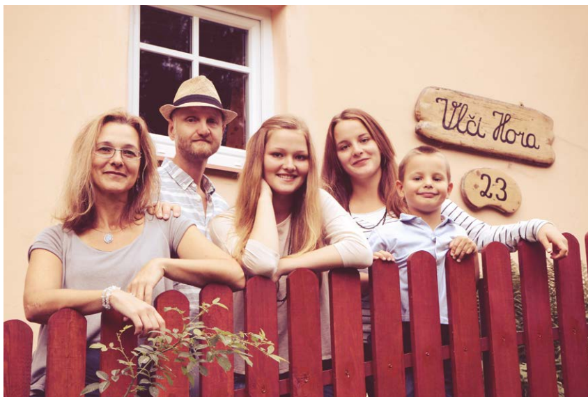
V roce 1997 se rodina Zrubeckých přestěhovala na Vlčí Horu, do domu po prababičce. Šťastnou náhodou se právě sem v roce 2004 přestěhovala i společnost Nobilis Tilia.

Vyšla Vám kniha Aromaterapie podle ročních období, v současné době se tomuto tématu věnujete i na blogu... Co bylo motivem sepsání knihy?