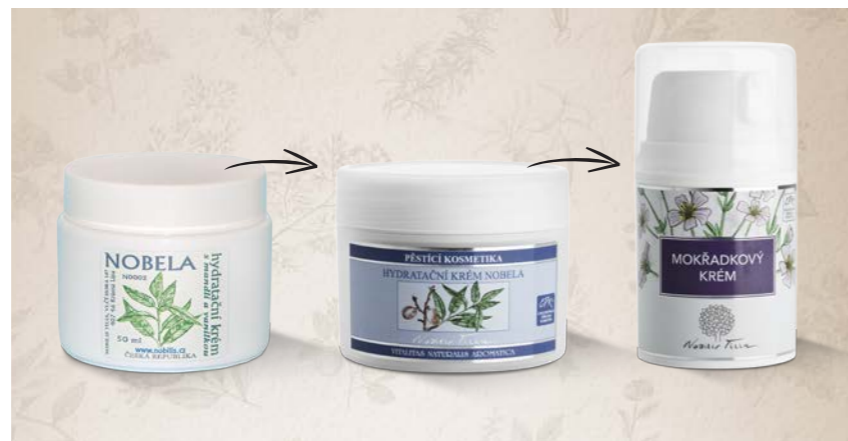
Takto se vyvíjel náš první Hydratační krém Nobela – dnes je z něho Mokřadkový krém

druhým domovem, který to vždy voní po levanduli, rozmarýnu a tymiánu. Průběžně jsem navštěvoval kongresy aromaterapie a fytotherapie v Montpellier, Grasse, seznamoval se s důležitými osobnostmi, projížděl oblast Provence a pohoří Seven. A učil se. Začít u lahvičky s vonnou esencí totiž nestačí. Je potřeba navštívit místa, kde rostliny, ze kterých esence pochází, žijí, pozorovat je a přemýšlet o základní úloze účinné látky v jejím přirozeném prostředí , v přírodě. Také jsem si rozšiřoval obzory a přidával zájem o ajurvědu, studoval v Praze několik let tradiční čínskou medicínu, prováděl vlastní pokusy a pročítal odborné knihy.