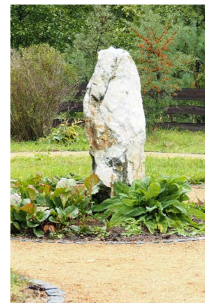
Část mandaly Matky Země a Života

To je skutečně těžká otázka. Za každým z našich výrobků stojí hodně práce, ale i krásných vzpomínek. Sám osobně vnímám jako jeden z našich největších