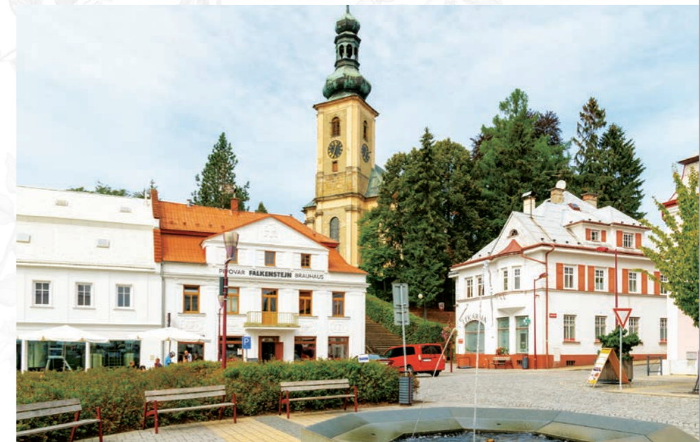
Krásná Lípa, naše první působiště